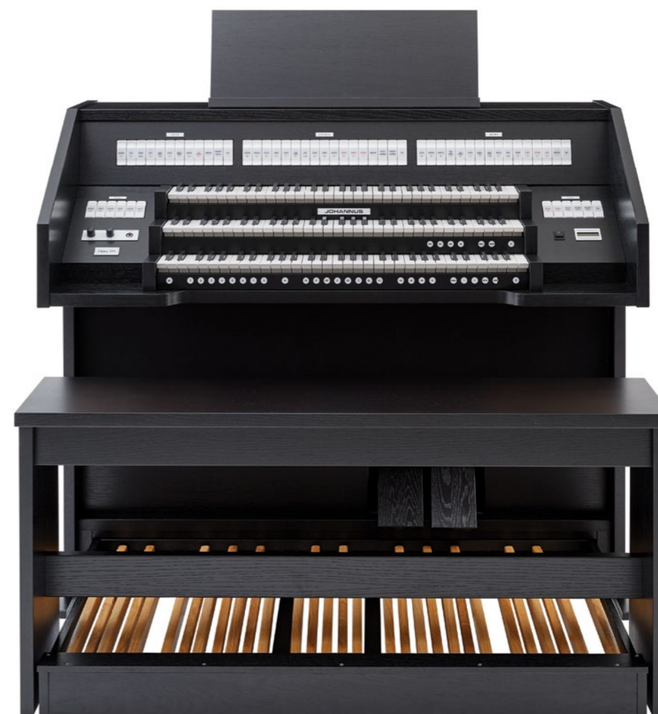
Opus ~ 355

Ces modèles élégants d'orgues sont proposés dans plusieurs teintes, ce qui fait de l'Opus un bel élément décoratif dans tout intérieur.